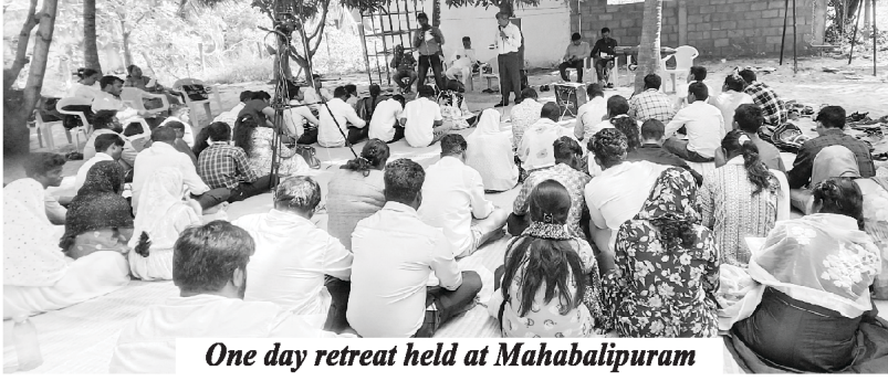
One day retreat held at Mahabalipuram

26/01/2024ರಂದು ಮುಖ್ಯ ಸಭೆಯ ಯಾವ್ವಸ್ಥರು, ನೆಹಮೀಯ ಸತ್ಯವೇದ ಕಾಲೇಜಿನ ವಿದ್ಯಾರ್ಥಿಗಳನ್ನೊಳಗೊಂಡು ಸುಮಾರು 60 ಜನರು ಒಂದು ಸಭೆಯನ್ನು ಮಹಾಬಲಿಪುರಂನಲ್ಲಿ ಅಯೋಜಿಸಲಾಗಿತ್ತು, ಕರ್ತನು ಅಶೀರ್ವದಿಸಿದನು.