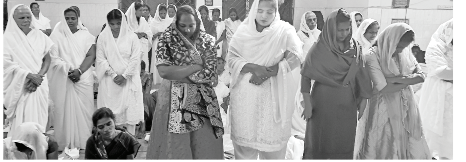
मध्य रात्रीची नवीन वर्षाची उपासना