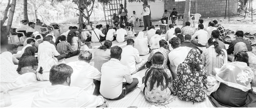
महाबलीपूरम येथील एक दिवसीय शिबीर

आमच्या मुख्य मंडळीच्या बहुविध कार्यात आघाडीवर कार्यकरणाच्या आमच्या देवाच्या सेवकांकरिता प्रार्थना करा.