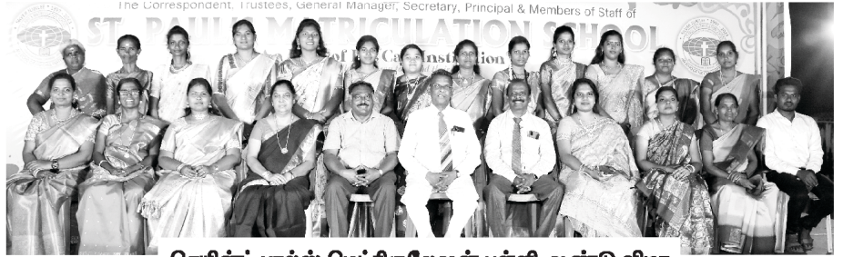
செயின்ட் பால்ஸ் மெட்ரிகுலேஷன் பள்ளி ஆண்டு விழா

நமது செயின்ட் பால்ஸ் மெட்ரிகுலேஷன் பள்ளியில் ஆண்டு விழா, மார்ச் 2, 2024 அன்று சிறப்பாக நடைபெற்றது என்பதை மகிழ்ச்சியுடன் தெரிவித்துக் கொள்கிறோம். அன்று மாணவர்கள் தங்கள் திறமைகளை அருமையாக வெளிப்படுத்தினர். மாணவர்களின் பெற்றோர், குழந்தைகள், சுற்றுப்புறத்தில் வசிக்கும் நண்பர்கள் போன்ற பலர் அந்நிகழ்ச்சியில் கலந்து கொண்டனர். அது ஒரு ஆவிக்குரிய கன்வென்ஷன் கூட்டம் மற்றும் சுகமளிக்கும் விடுதலைக் கூட்டம் போலக் காணப்பட்டது. எங்களுக்காக ஜெபிக்கும் உங்கள் தொடர் ஜெபங்களுக்கு நாங்கள் நன்றியுள்ளவர்களாய் இருக்கிறோம்.