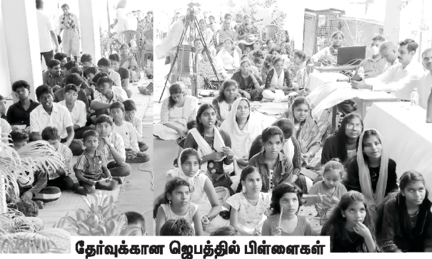
தேர்வுக்கான ஜெபத்தில் பிள்ளைகள்

உங்கள் மேலும், உங்கள் குடும்பங்கள் மேலும், உங்கள் தேசத்தின் மேலும் தேவ ஆசீர்வாதம் பொழியப்பட வேண்டும் என்று தேவனிடத்தில் வேண்டிக் கொள்கிறோம்.