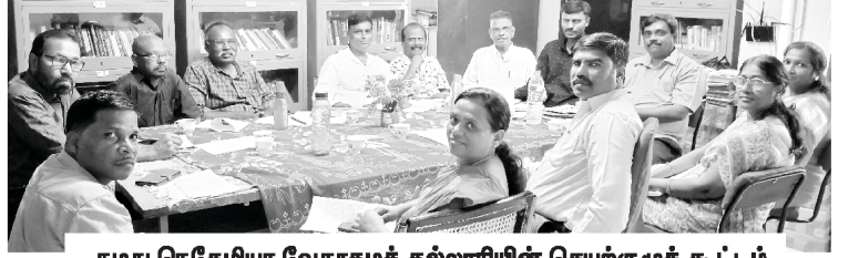
நமது நெகேமியா வேதாகமக் கல்லூரியின் செயற்குழுக் கூட்டம்

ஒவ்வொரு மாதமும் நமது நெகேமியா வேதாகமக் கல்லூரியின் தலைவர் மற்றும் முதல்வர் ஆகியோர் தலைமையில், கல்லூரி ஆசிரியர்கள்