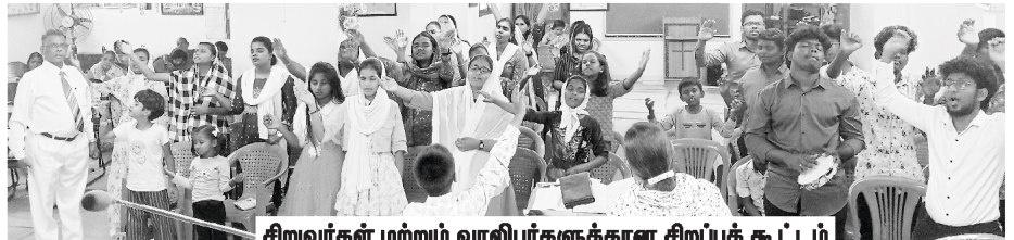
சிறுவர்கள் மற்றும் வாலிபர்களுக்கான சிறப்புக் கூட்டம்

மார்ச் 3, 2024 அன்று, சிறுவர்கள் மற்றும் வாலிபர்களுக்கான சிறப்புக் கூட்டத்தையும், செயின்ட் பால்ஸ் மெட்ரிகுலேஷன் பள்ளி வளாகத்தில் நடத்தினோம். சுமார் 100 நபர்கள் அதில் கலந்து கொண்டார்கள். அதில் ஆவிக்குரிய சிறப்புப் பாடல்கள், சாட்சிகள், செய்திகள் என்று பல நிகழ்ச்சிகள் இடம் பெற்றன.