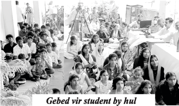
Gebed vir student by hul openbare eksamen

Ons ontmoet gereeld jong kinders op Sondag na die kerkdienste. Hierdie kinders word opgevoed in God se weë. Ons benodig meer studente, goeie onderwysers en leiers vir ons St. Paul Matrikulasieskool en Nehemia Bybelkolleges in Hindi en Tamil. Daarby wil ons graag meer lesers hê van ons Echo of His Call nuusblad in 16 tale. Stuur asseblief vir ons adresse van vriende en familie, sodat ons die nuusblad in hul eie tale vir hulle kan stuur, gratis. Ons sal ook graag meer lesers daarvan in die Urdu-taal wou kry. Enige manier waarop julle kan help sal baie waardeer word en God sal julle beloon.