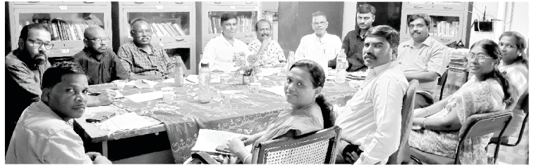
Nehemia Bybelskool Raadsvergadering