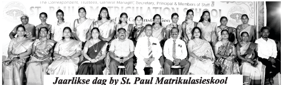
Jaarlikse dag by St. Paul Matrikulasieskool

Ons is baie dankbaar om te kan vertel van die sukses van die Jaarlikse Dagfeesvierings by ons St. Paul Matrikulasieskool wat op 2 Maart 2024 gehou is. Dit studente het hul talente daar vertoon en baie ouers het dit bygewoon, asook kinders en inwoners van die omliggende gebiede. Dit was soos 'n konferensie en bevrydingsbyeenkoms, en ons is dankbaar vir julle volgehoue gebede.