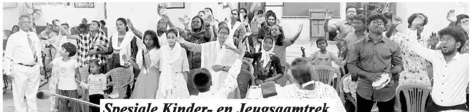
Spesiale Kinder- en Jeugsaaamtrek

Op 3 Maart 2024 het ons 'n spesiale Kinder- en Jeugbyeenkoms gehou by die kampus van St. Paul Matrikulasieskool . Ongeveer 100 lede het dit bygewoon en daar was spesiale liedere, getuïenisse en boodskappe.