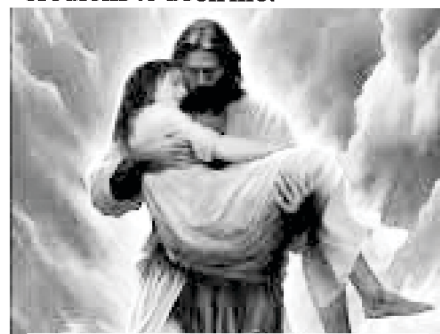
Jesus Christus gee om vir jou!

Satan's Yoke. Hy hou ons voortdurend besig sodat ons nie tyd het om te bid, of in die Bybel te lees, of te vas, oordink, onderlinge kuiers, of om saam erediens te doen nie.