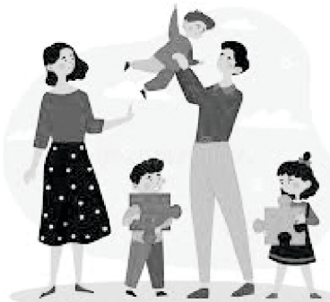
God het drie kinders gegee en hulle geseën.

Eindelik het die man my toe vertel dat sy vrou swanger geraak het en die dokter het dit daardie dag bevestig. Hulle was baie gelukkig en in die geskenkpak was daar baie kledingstukke en nuttigheide vir my bediening. God het vir hulle 'n dogter gegee en hulle later met nog twee seuns geseën.