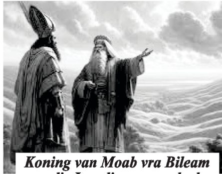
Koning van Moab vra Bileam om die Israëliete te vervloek.

In Numerie 22 lees ons die profeet Bileam se verhaal. Die Bybel sê hy het die mag gehad om te seën en te vervloek, daarom het Moab se koning hom drie keer gevra om die Israëliete te vervloek. Maar van meet af het hy geweet dit is nie God se wil nie. Tog was hy soos die donkie vas by die kruispad – gebind aan geld, roem, besittings,