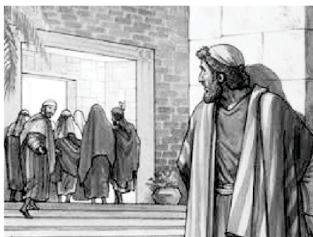
Petrus volg Hom op 'n afstand.

Die Bybel vertel die verhaal van 'n man wat Jesus op 'n afstand