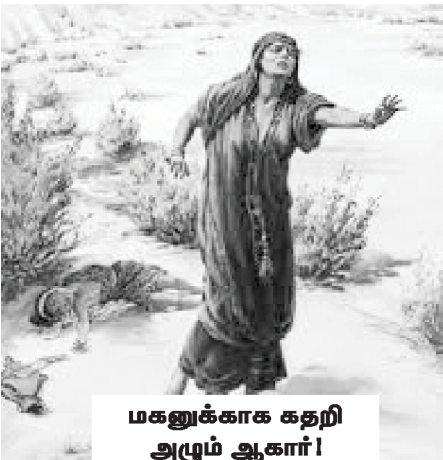
மகனுக்காக கதறி அழும் ஆகார்!

இந்த சோதனை ஆகாருக்கும் அவளது சூமாரனுக்கும் மிகுந்த பெலனீனத்தையும் களைப்பையும்