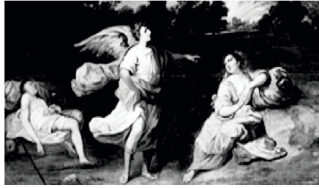
ஆகாரூடன் பேசும் தேவதூதன்!

‘நீ எழுந்து பிள்ளையை எடுத்து, அவனை உன் கையினால் பிடித்துக் கொண்டு போ, அவனைப் பெரிய ஜாதியாக்குவேன்’ என்றார் ஆதியாகமம் 21:18 தாய்மார்கள் ஜெபிக்கும்பொழுது, அவர்களது பிள்ளைகளின் எதிர்காலத்தைப்