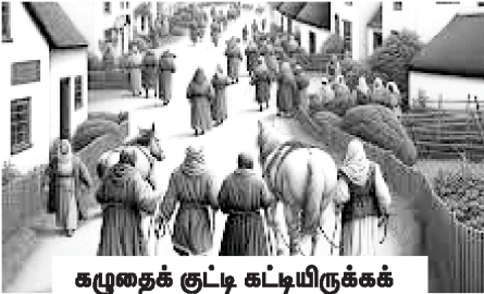
கழுதைக் குட்டி கட்டியிருக்கக் கண்ட சீஷர்கள்!

உங்களுக்கு எதிரேயிருக்கிற கிராமத்திற்குப் போங்கள்; அதில் பிரவேசித்தவுடனே, மனுஷர் ஒருவரும் ஒருக்காலும் ஏறியிராத ஒரு கழுதைக் குட்டி கட்டியிருக்கக் காண்பீர்கள், அதை அவிழ்த்து கொண்டு வாருங்கள். மாற்கு 11:2