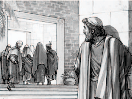
பேதுரு, தூரத்திலே அவருக்குப் பின்சென்றார்!

ஆனால் நீங்கள் இவ்வாறு கூறலாம், “நான் என் சிறு வயது முதலே கர்த்தருக்கு ஊழியம் செய்து வருகிறேன். ஆனால் எனக்கு நடந்ததைப் பாருங்கள்; இது எனக்கு நடந்திருக்கக்கூடாது. இப்பொழுதோ நான்