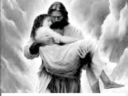
இயேசு கிறிஸ்து உங்களை இரட்சிக்கிறார்!

அவரது நுகம் மெதுவாயும், இலகுவாயும் இருக்கிறது (மத்தேயு 11:28-30).