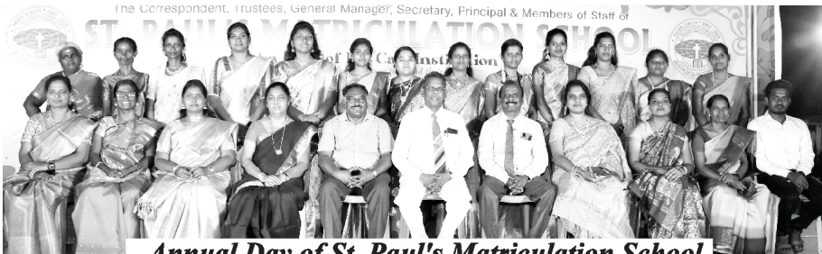
Annual Day of St. Paul's Matriculation School

අපගේ සභාවේ සෑම ඉරුදින දේව මෙහෙයන්වල තරුණ තරුණියන් මුණගැසුනි. මෙම සියලුම දරුවන් දේව හයෙන් යුතුව වර්ධනය වෙයි. අපගේ ශාන්ත පාවුල් මෙට්‍රිකියුලේෂන් පාසලට හොඳ ගුරුවරුන් හා තවත් බොහෝ දරුවන් අවශ්‍යව ඇත. එසේම නෙහෙමියා බයිබල් විදුහලේ හින්දි හා දෙමළ භාෂාවන් වලින් ඉගැන්වීමට හොඳ දාසයින් අවශ්‍යව ඇත.