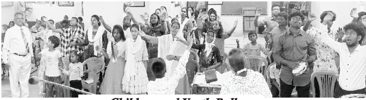
Children and Youth Rally