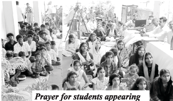
Prayer for students appearing Public Examination

පූජක M. මුක්තුගේ නායකත්වය යටතේ අපගේ නෙහෙමියා බයිබල් විදුහල කාකර මඩුල්ල සෑම මසකදීම රැ