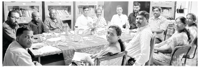
Nehemiah Bible College Board Meeting

ස්වෙති. එසේම අලුතින් අප හා සමඟ එකතු වී සිටින පූජක ජෝන් රාජරත්නම් විදුහල්පති තුමා සමඟ මෑතකදී මේ පාසලේ දියුණුව උදෙසා සාකච්ඡාවක් පැවැත්වුවේය.