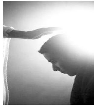
Divine touch of Jesus Christ!

සිටියෙමි. වෛද්‍යවරුන් මා හට ශල්‍යකර්මයක් කිරීමට අවශ්‍යයි කියා පැවසුවත් ඒ සඳහා මට දිනයක් ලැබුනේ නැත. එවිට මා මගේ හදවතින් දෙවියන්වහන්සේට කන්නලව් කරමින්, ‘ලෝකයෙහි මට උපකාර කිරීමට කිසිවෙක් නැහැ. මේ සේවයේදීත් මා හට උපකාර කිරීමට කිසිවෙක් නැහැ’ කියා පැවසුවෙමි. “මාගේ මාර්ග කියාදුනිමි. ඔබ මට උත්තරදුන්නේක...” (භිතාවලිය 119:26)