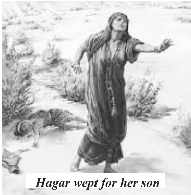
Hagar wept for her son

හාගර් සහ ඇගේ පුත්‍රයා ඉතා අසීරු තත්වයකට පත්විය. ඇගේ පුත්‍රයා වතුර නොමැතිව මැරෙන්නට යන අවස්ථාවේදී හාගර් එය ඇගේ ඇසින් දැකීමට අකමැති වූ නිසා මෙසේ පවසනු ලැබීය.