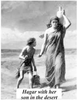
Hagar with her son in the desert

දේව වචනයෙහි මෙසේ සඳහන් කරයි. “ආබ්‍රහම් අප්‍රයම නැගිට රොටී සහ වතුර භාජනයකුත් ගෙන හාගර්ගේ කරේ තබා දරුවාද ඇයට දී ඇයට යන්ට හැරියේය. ඇය පිටත්ව ගොස් බෙයර්-ෂෙබා නම් වනයෙහි මංග්‍රලාවුවාය.” (උත්පත්ති 21:14)