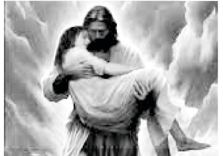
യേശുക്രിസ്തു നിങ്ങളെ പരിപാലിക്കുന്നു!

വാതിലിലാണ് അവർ ബന്ധിക്കപ്പെട്ടിരിക്കുന്നത്. തിരക്കുള്ളത് എന്നു പറഞ്ഞാൽ എന്താണ് സൂചിപ്പിക്കുന്നത് എന്നു നിങ്ങൾക്ക് അറിയാമോ? സാത്താന്റെ നുകത്തിൻ കീഴിലായിരിക്കുക എന്നാണ്. പ്രാർത്ഥിക്കാനും വചനം വായിക്കാനും ഉപവസിക്കാനും ധ്യാനിക്കാനും കൂട്ടായ്മ പുലർത്താനും ആലയത്തിൽ പോകുവാനും നമുക്ക് സമയം