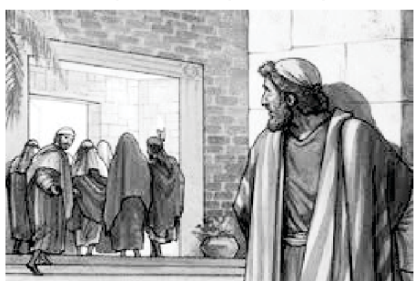
പത്രോസ് ദൂരെ മാറി അവനെ അനുഗമിച്ചു

“ഞാൻ കുട്ടിക്കാലം മുതൽ കർത്താവിനെ സേവിക്കുന്നതാണ്. എനിക്ക് സംഭവിച്ചത് നോക്കൂ, ഇതു ഞാൻ അർഹിക്കുന്നതല്ല. ഞാൻ ഇനി ദൈവത്തോടു അടുത്തുവരാൻ ആഗ്രഹിക്കുന്നില്ല. ഞാൻ അവനോടു അടുത്തുചെന്ന് മുറിവേൽക്കുന്നതിനേക്കാളും അകന്നു നിൽക്കുന്നതാണ് നല്ലത്. ദൂരെ നിന്ന് അവനെ അനുഗമിക്കാനാണ് എനിക്ക് ഇഷ്ടം.” നമുക്ക് ലോകവും ദൈവവും വേണം.