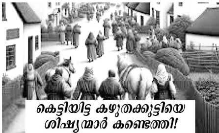
കെട്ടിയിട്ട കഴുതക്കുട്ടിയെ ശിഷ്യന്മാർ കണ്ടെത്തി!

നിങ്ങൾക്കു എതിരെയുള്ള ഗ്രാമത്തിൽ ചെല്ലുവിൻ; അതിൽ കടന്നാൽ ഉടനെ ആരും ഒരിക്കലും കയറീട്ടില്ലാത്ത ഒരു കഴുതക്കുട്ടിയെ കെട്ടിയിരിക്കുന്നതു കാണും; അതിനെ അഴിച്ചു കൊണ്ടുവരുവിൻ (മർക്കൊസ് 11:2)