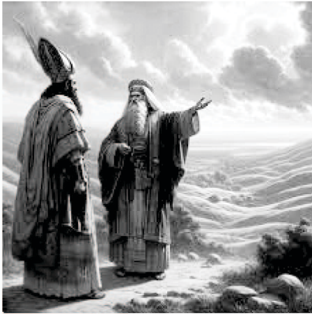
മോവാബ് രാജാവ് ബാലാക്കിനോട് യിസ്രായേലയുടെ ശപിക്കാൻ പറയുന്നു.

സംഖ്യാപുസ്തകം 22-ാം അദ്ധ്യായം പ്രവാചകനായ ബിലെയാമിന്റെ കഥ പറയുന്നു. വേദപുസ്തകം പറയുന്നതുപോലെ അനുഗ്രഹിക്കാനും ശപിക്കാനും അദ്ദേഹത്തിന് അധികാരമുള്ളതിനാൽ യിസ്രായേലയുടെ ശപിക്കാൻ മോവാബ് രാജാവ് മൂന്നു തവണ ബിലെയാമിനോട് അഭ്യർത്ഥിച്ചു. അത് ദൈവഹിതമല്ലെന്ന് ആദ്യം മുതലേ അവൻ അറിയാമായിരുന്നു. എന്നിരുന്നാലും പണം, പ്രശസ്തി, സ്വത്തുക്കൾ, അധികാരം, പൊതുശ്രദ്ധ എന്നിവയുമായി ബന്ധപ്പെട്ട് ഇടനാഴിയിൽ കെട്ടപ്പെട്ട കഴുതയെപ്പോലെ അവൻ ആയി