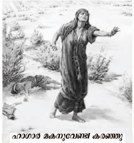
ഹാഗാർ മകനുവേണ്ടി കരഞ്ഞു

ഈ ദുരന്തം ഹാഗാറിനെയും മകനെയും ക്ഷീണിപ്പിക്കുന്നതായിരുന്നു, അത് മകന്റെ