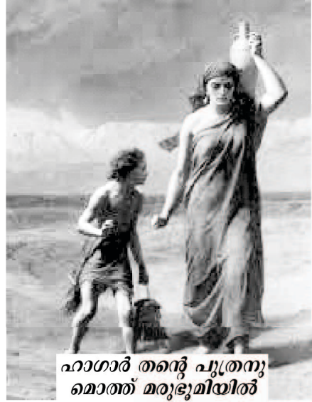
ഹാഗാർ തന്റെ പുത്രനു മൊത്ത് മരുഭൂമിയിൽ 06-ാം പേജിൽ തുടരും...

ഹാഗാറിനു സമാനമായ ഒരു മരുഭൂമിയിലൂടെ നിങ്ങൾ സഞ്ചരിക്കുകയോ, ഭാവിയെക്കുറിച്ച് അനശ്ചിതത്വം തോന്നുകയോ അല്ലെങ്കിൽ ഒരു പക്ഷേ ഭാവിയെക്കുറിച്ച് സങ്കല്പിക്കാൻ കഴിയാതെ വരികയോ ചെയ്താൽ അവനിൽ ആശ്രയം കണ്ടെത്തുവിൻ. ഓർക്കുക, നിങ്ങൾ ദൈവത്തിന്റെ നിയന്ത്രണത്തിലാണ്; അവൻ നിങ്ങൾക്ക് വഴികാട്ടിയായിരിക്കും. അവന്റെ കരങ്ങൾ പിടിച്ചു നിങ്ങളുടെ ഇഷ്ടം അവനിൽ സമർപ്പിക്കുവിൻ.