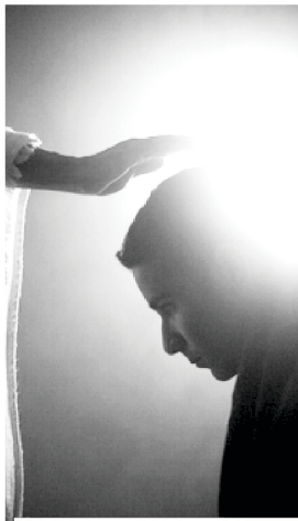
യേശുക്രിസ്തുവിന്റെ ദൈവിക സ്വർഗം!

പിന്നെ ഒരു രാത്രിയിൽ ഞാൻ തീഷ്ണതയോടെ പ്രാർത്ഥിച്ചപ്പോൾ ദൈവത്തിന്റെ രോഗശാന്തിയുടെ കരത്തിന്റെ സ്വർഗം ഞാൻ അനുഭവിച്ചു. ഞാൻ അത് മനസ്സിലാക്കിയപ്പോൾ ചികിത്സിക്കുന്ന ഡോക്ടറോട് ഞാൻ വിവരം പറഞ്ഞു. “എനിക്കു മനസ്സിലായി, പല ക്രിസ്ത്യാനികളും യേശുക്രിസ്തു തങ്ങളെ സൗഖ്യമാക്കി എന്നു പറഞ്ഞ് ചികിത്സ നിഷേധിക്കുന്നുണ്ട്. നിങ്ങളും അത്തരത്തിലുള്ള പ്രഖ്യാപനമാണ് നടത്തിയിരിക്കുന്നത്.” പക്ഷെ ഓപ്പറേഷനുവേണ്ടി