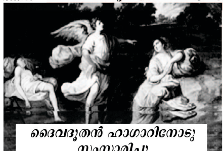
ദൈവദൂതൻ ഹാഗാറിനോടു സംസാരിച്ചു

തീക്ഷ്ണമായ പ്രാർത്ഥനയ്ക്കു മറുപടിയായി ഇസ്മായേലിന്റെ ഭാവി എന്തായിരിക്കുമെന്ന് ദൈവം അവൾക്കു വെളിപ്പെടുത്തിക്കൊടുത്തു.