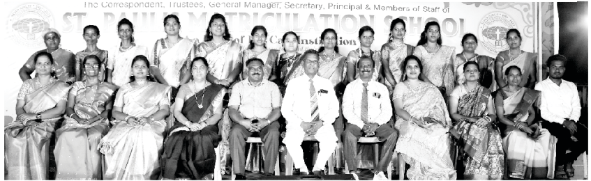
Annual Day of St. Paul's Matriculation School

हमें अपने सेंट पहल मैट्रिकुलेशन स्कूल में 2 मार्च, 2024 को आयोजित वार्षिक दिवस समारोह की सफलता की रिपोर्ट प्रस्तुत करते हुए खुशी हो रही है। छात्रों ने कार्यक्रम के दौरान अपनी प्रतिभा का प्रदर्शन किया, और इसमें कई माता-पिता, बच्चों और आसपास के क्षेत्र के निवासियों ने भाग लिया। यह एक सम्मेलन और मुक्ति सभा जैसा था, और हम आपकी निरंतर प्रार्थनाओं के लिए धन्यवाद देते हैं।