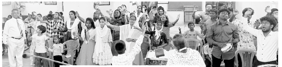
Children and Youth Rally

हम कलीसिया की आराधना के बाद हर रविवार को नियमित रूप से छोटे बच्चों से मिलते हैं। इन बच्चों का परमेश्वर के मार्गों में बढ़ाया जाता है। हमें अपने सेंट पौल्स मैट्रिकुलेशन स्कूल और नहेमायाह बाइबल कॉलेजों के लिए हिंदी और तमिल भाषाओं में अधिक छात्रों, अच्छे शिक्षकों और अगुवों की आवश्यकता है। इसके अतिरिक्त, हमें सभी 96 भाषाओं में मासिक समाचार पत्र, एको ऑफ़ हिज़ कॉल के लिए अधिक पाठकों की आवश्यकता है। कृपया हमें अपने मित्रों और रिश्तेदारों