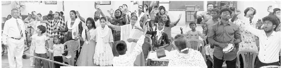
Children and Youth Rally

ನಾವು ಕ್ರಮವಾಗಿ ಪ್ರತಿವಾರ ಆರಾಧನೆ ಆದ ಮೇಲೆ ಯೌವನಸ್ಥ ಮಕ್ಕಳನ್ನು ಭೇಟಿಯಾಗುತ್ತೇವೆ. ಈ ಮಕ್ಕಳು ದೇವರ ಮಾರ್ಗದಲ್ಲಿ ಬೆಳೆಯಬೇಕು. ಇನ್ನೂ ನಮಗೆ ಹೆಚ್ಚು ವಿದ್ಯಾರ್ಥಿಗಳು, ಒಳ್ಳೆಯ ಶಿಕ್ಷಕರು