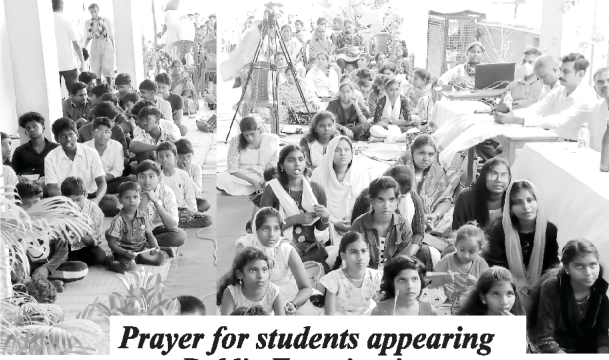
Prayer for students appearing Public Examination

ಮತ್ತು ನಾಯಕರುಗಳು ನಮ್ಮ ಸಂತ ಮೆಟ್ರಿಕ್ಯೂಲೇಷನ್ ಶಾಲೆ ಮತ್ತು ನೆಹಮೀಯಾ ಸತ್ಯವೇದ ಕಾಲೇಜಿಗೆ ಬೇಕಾಗಿದ್ದಾರೆ. ಇದರ ಜೊತೆಗೆ, 16 ಭಾಷೆಗಳಲ್ಲಿರುವ ನಮ್ಮ ಆತನ ಕರೆಯ ಪ್ರತಿಧ್ವನಿಯ ಮಾಸಪತ್ರಿಕೆಗೆ ಹೆಚ್ಚು ಓದುಗರು ಬೇಕಾಗಿದ್ದಾರೆ. ದಯಮಾಡಿ ನಿಮ್ಮ ಸ್ನೇಹಿತರ ಮತ್ತು ಸಂಬಂಧಿಕರ ವಿಳಾಸವನ್ನು ನಮಗೆ ಒದಗಿಸಿರಿ. ಅವರ ಭಾಷೆಯಲ್ಲಿ ಆತನ ಕರೆಯ ಪ್ರತಿಧ್ವನಿಯ ಮಾಸಪತ್ರಿಕೆಯನ್ನು ಉಚಿತವಾಗಿ ಕಳುಹಿಸಿ ಕೊಡುತ್ತೇವೆ. ನಮ್ಮ ಆತನ ಕರೆಯ ಪ್ರತಿಧ್ವನಿಯ ಉರ್ದುಪತ್ರಿಕೆಯನ್ನು ಓದುವವರು ಹೆಚ್ಚು ಬೇಕಾಗಿದ್ದಾರೆ. ಯಾವುದೇ ರೀತಿಯಲ್ಲಿ ನಮಗೆ ಚಿಕ್ಕದಾಗಿ ಅಥವಾ ದೊಡ್ಡದಾಗಿ ನಮಗೆ ಸಹಾಯ ಮಾಡಿರಿ. ನಾವು ನಿಮ್ಮನ್ನು ಅಭಿನಂದಿಸುತ್ತೇವೆ. ದೇವರಿಂದ ನಿಮಗೆ ಬಹುಮಾನವು ದೊರೆಯುವಂತಾಗಿರುವುದು.