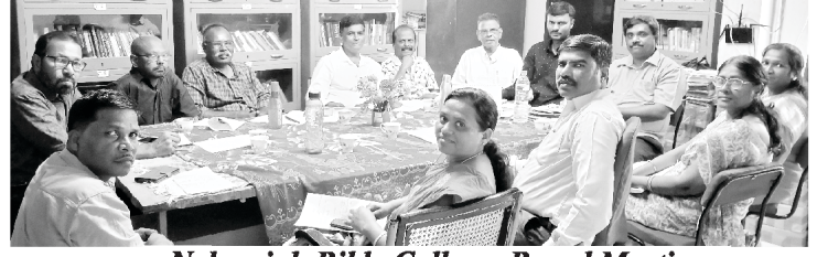
Nehemiah Bible College Board Meeting

ಜಗತ್ತಿನ ಎಲ್ಲಾ ದೇಶಗಳಲ್ಲಿ ಸಮೃದ್ಧಿ ಮತ್ತು ಶಾಂತಿಗಾಗಿ ನಾವು ನಿರಂತರವಾಗಿ ಪ್ರಾರ್ಥನೆ ಮಾಡುತ್ತಾ ಇದ್ದೇವೆ. ಪ್ರಾಮುಖ್ಯವಾಗಿ ಭಾರತ ದೇಶದ ಆತ್ಮಿಕ ಸಮೃದ್ಧಿಗಾಗಿ ಪ್ರಾರ್ಥನೆ ಮಾಡುತ್ತಾ ಇದ್ದೇವೆ. ನಿಮ್ಮ ಮೇಲೆ, ಕುಟುಂಬ, ನಿಮ್ಮ ದೇಶದಲ್ಲಿ ದೇವರ ಆಶೀರ್ವಾದವು ನಿಮ್ಮ ಮೇಲೆ ಸುರಿಯಲಿ ಎಂದು ನಾವು ನಿರಂತರವಾಗಿ ಪ್ರಾರ್ಥಿಸುತ್ತೇವೆ.