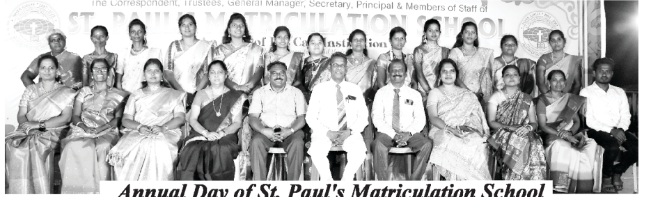
Annual Day of St. Paul's Matriculation School

ನಮ್ಮ ವಿವಿಧ ಸೇವೆಯಲ್ಲಿ ಪ್ರತ್ಯುತ್ತರವನ್ನು ಸ್ವೀಕರಿಸುವುದರಲ್ಲಿ ನಾವು ತುಂಬಾ ಉತ್ಸುಕರಾಗಿದ್ದೇವೆ. ಆತನ ಕರೆಯ ಪ್ರತಿಧ್ವನಿಯು 16 ಭಾಷೆಗಳಲ್ಲಿರುವ ಮಾಸಪತ್ರಿಕೆಯನ್ನು ಒಳಗೊಂಡು, ನಾಲ್ಕು ಭಾಷೆಗಳಲ್ಲಿರುವ ಆತನ ಕರೆಯ ಪ್ರತಿಧ್ವನಿಯ ಯು ಟ್ಯೂಬ್ ಚಾನೆಲ್, ಬೈಬಲ್ ಕೋರ್ಸ್, 3 ಭಾಷೆಗಳಲ್ಲಿ ಮೂಲ ಸತ್ಯವೇದ ದೂರಶಿಕ್ಷಣದ ಕೋರ್ಸ್‌ಗಳು, 2 ಭಾಷೆಗಳಲ್ಲಿ ದೈವಶಾಸ್ತ್ರದ ದೂರ ಶಿಕ್ಷಣ ಕೋರ್ಸ್‌ಗಳು, ಮೂರು ವಿವಿಧ ಸ್ಥಳಗಳಲ್ಲಿ ನೆಹಮಿಯೆ ಸತ್ಯವೇದ ಕಾಲೇಜ್, ಸಂತ ಪೌಲ ಮೆಟ್ರಿಕ್ಯೂಲೇಷನ್ ಶಾಲೆ (ಹಳ್ಳಿಯ ಅಂಗ ಪ್ರಾಧಿಕಾರ). ಮುಖ್ಯ ಸಭೆ ಮತ್ತು ಶಾಖೆ ಸಭೆಗಳು. ಜಗತ್ತಿಗೆ ಸಮಾರ್ಥನೆಯನ್ನು ಸಾರುವುದಕ್ಕೆ ನಾವು ಆಸಕ್ತಿಯಿಂದ ಕಾರ್ಯನಿರ್ವಹಣೆಗೈದ್ದೇವೆ. ನಾವು ಬಹಳ ಪ್ರಾಮಾಣಿಕವಾಗಿ ನಿಮ್ಮ ಸಹಕಾರ ಮತ್ತು ಸಹಾಯವನ್ನು ಬಯಸುತ್ತೇವೆ. ನಾವು ನಿಮ್ಮ ಉತ್ತರಕ್ಕಾಗಿ ಬಹಳ ಉತ್ಸುಕರಾಗಿದ್ದೇವೆ.