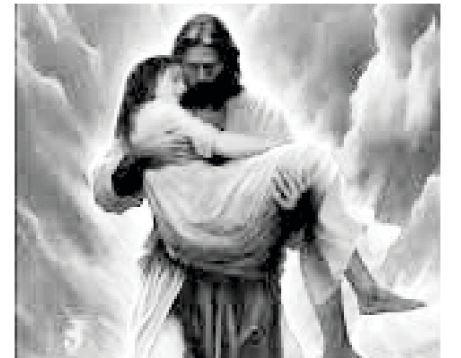
Jesus Christ cares for you!

ಬ್ಯುಸಿ ಎಂದರೆ ಏನು ಎಂದು ನಿಮಗೆ ತಿಳಿದಿದೆಯೇ? ಸೈತಾನನ ನೋಡದ ಅಡಿಯಲ್ಲಿ, ಆತನು ನಿರಂತರವಾಗಿ ನಮ್ಮನ್ನು ಕಾರ್ಯ ನಿರತವಾಗಿರಿಸಿಕೊಳ್ಳುತ್ತಿದ್ದಾನೆ. ಆದ್ದರಿಂದ ನಮಗೆ ಅರಿವಿಲ್ಲದೆ ಪ್ರಾರ್ಥನೆ ಮಾಡಲು, ಸತ್ಯವೇದ ಓದಲು, ಉಪವಾಸ ಮಾಡಲು, ಧ್ಯಾನಿಸಲು, ಸಂಬಂಧಗಳನ್ನು ಮಾಡಲು ಮತ್ತು ಸಭೆಗೆ ಹೋಗಲು ಸಮಯವಿಲ್ಲ.