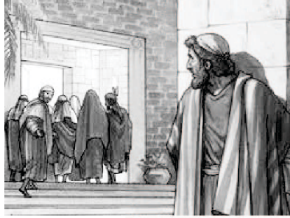
Peter followed him at a distance

ಯೇಸುಕ್ರಿಸ್ತನನ್ನು ದೂರದಲ್ಲಿ ಅನುಸರಿಸುವುದು ಅಪಾಯಕಾರಿ ಕಾರ್ಯವಾಗಿದೆ. ನೀವು ಶಿಷ್ಯರಲ್ಲೇ ನಿಮ್ಮನ್ನು ಕಂಡುಕೊಳ್ಳುವಿರಿ ಅಥವಾ ನೀವು ಈಗಾಗಲೇ ದೇವರಿಂದ ದೂರ ಸರಿಯುವ