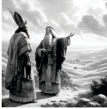
King of Moab requested Balaam to curse the Israelites.

ಅರಣ್ಯಕಾಂಡ - 22 ಆಧ್ಯಾಯವು ಪ್ರವಾದಿಯಾದ ಬಲಾಮನ ಕಥೆಯ ಬಗ್ಗೆ ಹೇಳುತ್ತದೆ. ಆತನಿಗೆ ಅಶೀರ್ವಾದ ಮತ್ತು ಶಾಪವನ್ನು ಕೊಡುವ ಶಕ್ತಿ ಇತ್ತು ಎಂದು ಸತ್ಯವೇದವು ಹೇಳುತ್ತದೆ. ಆದ್ದರಿಂದ ಮೋವಾಬನ ಅರಸನು ಬಲಾಮನನ್ನು ಇಸ್ರಾಯೇಲ್ಯರನ್ನು ಶಪಿಸುವುದಕ್ಕೆ