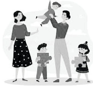
God granted three children and blessed them.

ಆದರೆ ಇನ್ನೂ ಏಕಾಂಗಿತತೆಯೊಂದಿಗೆ ಹೋರಾಡುತ್ತಿರಿ. ದೇವರು ಒಂಟಿತನ