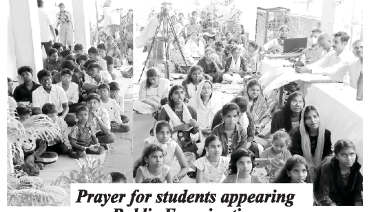
Prayer for students appearing Public Examination

कॉल मासिककरिता आणखीन वाचक हवे आहेत. तेव्हा आम्हाला तुमच्या मित्र मंडळींचे पते, फोन क्रमांक आणि भाषा कळवा, म्हणजे आम्ही त्या सर्वांना त्यांच्या भाषेतील मासिक प्रत्येक महिन्याला विनामुल्य पाठवीत जावू. उर्दू भाषिक मासिकाकरीता देखील वाचक हवे आहेत. तुमच्या छोटा-मोठ्या प्रमाणातील सहकार्याबद्दल आम्हाला आनंद होईल आणि देव त्याबद्दल तुम्हाला प्रतिफळ देईल.