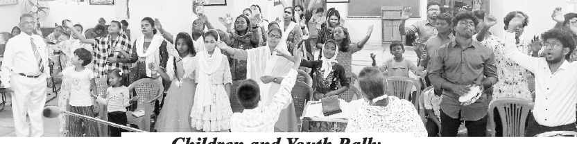
Children and Youth Rally