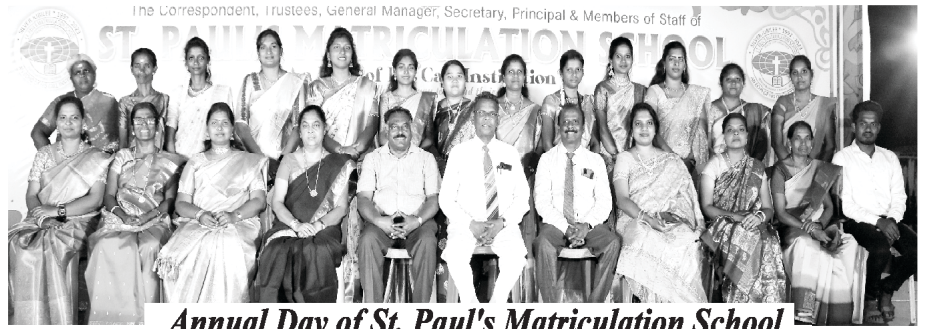
Annual Day of St. Paul's Matriculation School

आम्ही ३ मार्च २०२४ या दिवशी सेंट पॉलस् मॅट्रीक्युलेशन स्कूलच्या प्रांगणात लेकरांची आणि तरुणांची विशेष रॅली आयोजित केली होती. ज्यामध्ये विशेष गीते, साक्षी आणि संदेश