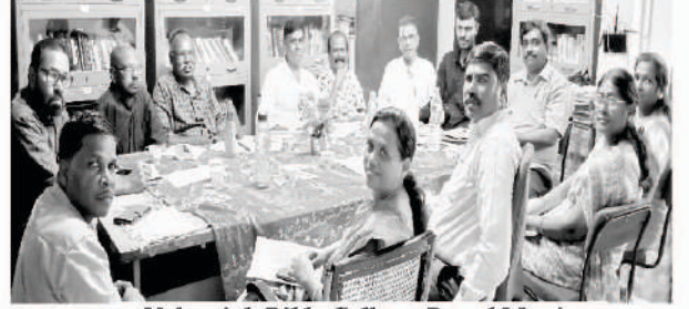
Nehemiah Bible College Board Meeting

আলোচনীখন বিনামূল্যত পঠাব পাৰো। উদ্ভূ ভাষাতো তেওঁৰ আহবানৰ প্ৰতিধ্বনিৰ পঢ়োৱেৰে প্ৰয়োজন হৈছে। সৰু বা ডাঙৰ যিকোনো উপায়ে আপোনাৰ সহায়ক প্ৰশংসা কৰা হ'ব আৰু আপুনি ঈশ্বৰৰ দ্বাৰাই পুৰস্কৃত হ'ব।