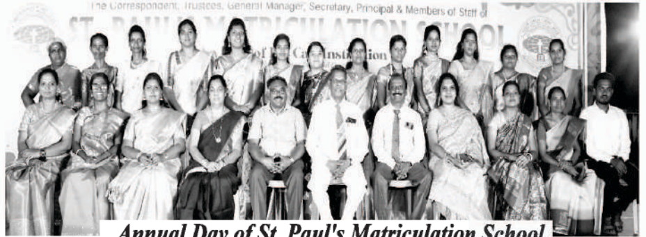
Annual Day of St. Paul's Matriculation School

যোৱা ২০২৪ চনৰ ৩ মাৰ্চত আমাৰ ছেইণ্ট পৌলচ্ মেট্ৰিকুলেশ্বন স্কুলৰ চৌহদত আমি শিশুসকলৰ আৰু যুৱসকলৰ সমাৰেশৰ আয়োজন কৰিছিলো। অনুমানিক ২০০ জন সদস্যই এই কাৰ্য্যসূচীত যোগদান কৰিছিল আৰু ইয়াত বিশেষ গীত, সাক্ষাৎদান আৰু বাৰ্তাসমূহক অন্তৰ্ভুক্ত কৰা হৈছিল।