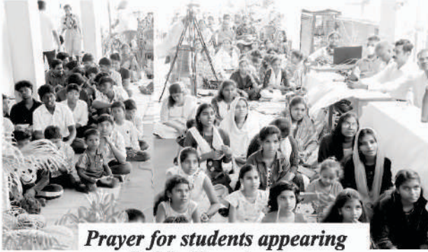
Prayer for students appearing Public Examination

পৃথিৱীৰ সমগ্ৰ দেশসমূহত শান্তি আৰু সমৃদ্ধিৰ বাবে আমি একেৰাহে প্ৰাৰ্থনা কৰি আছো। বিশেষভাৱে আমি ভাৰতৰ আধ্যাত্মিক সমৃদ্ধিৰ বাবে প্ৰাৰ্থনা কৰো। আপোনাৰ ওপৰত, আপোনাৰ পৰিয়ালৰ ওপৰত আৰু আপোনাৰ দেশৰ ওপৰত ঈশ্বৰে আশীৰ্বাদ বৰষাই দিবলৈ প্ৰাৰ্থনা কৰো।