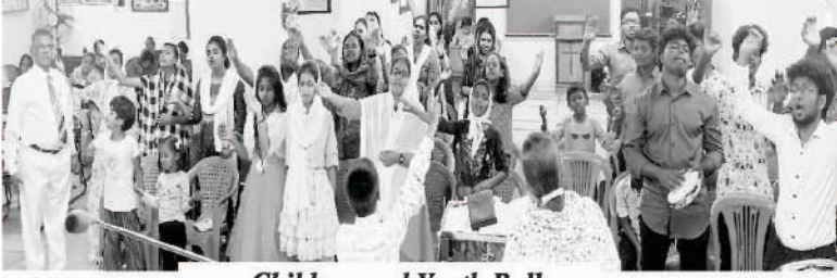
Children and Youth Rally