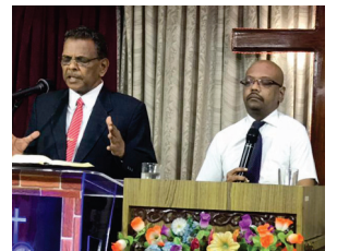
পালক এচ. চাম ছেলভা ৰাজ

অনলাইন দেওবৰীয়া উপাসনা ইক অৱ হিজ কল ইউ টিউব চেনেলত ইংৰাজী, হিন্দী আৰু তামিল এই তিনিটা ভাষাত আমি পুৱা ১০ঃ৩০ বজাত উপাসনা চলাই আছে। আপোনাক আদৰ্শ জনাইছো আৰু এই চেনেলটো চাবচক্ৰাইব কৰক। ই এক বিনামূলীয়া সেৱা।