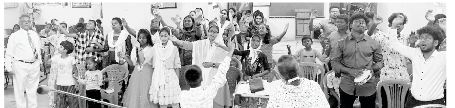
Children and Youth Rally

ચર્ચની ભજનસેવા બાદ અમે નિયમિતપણે દર રવિવારે જુવાન બાળકોને મળીએ છીએ. આ બાળકોને ઈશ્વરની બીકમાં ઉછેરવામાં આવ્યા છે. અમને આપણા સેન્ટ પોલ મેટ્રીક્યુલેશન