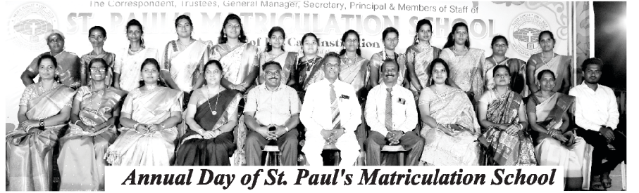
Annual Day of St. Paul's Matriculation School

અમને અમારી વિધવિધ મિનિસ્ટ્રીજોને માટે, જેમ કે ૧૬ ભાષાઓમાં પ્રકાશિત થતા ઈકો ઓફ હીજ કોલ સામયિકો, ૪ ભાષાઓમાંની ઈકો ઓફ હીજ કોલ યૂટ્યૂબ ચેનલો, ૩ ભાષાઓમાંના બાઈબલકોર. મૂળભૂત બાઈબલ પત્રવ્યવહાર અભ્યાસક્રમો, બે ભાષાઓમાંના ઈશ્વરવિદ્યાના પત્રવ્યવહાર અભ્યાસક્રમો, ત્રણ જુદા જુદા સ્થળોને આવેલી નહેમ્યા બાઈબલ કોલેજો, સેન્ટ પોલ મેટ્રીક્યુલેશન સ્કૂલ (ગ્રામ્ય અંગ્રેજી માધ્યમિક શાળા), મુખ્ય ચર્ચ અને શાળા ચર્ચો માટે પ્રતિસાદ મળી રહ્યા છે તેનાથી અમે રોમાંચિત છીએ. અમે સુવાર્તાનો વિશ્વમાં પ્રચાર કરવામાં સક્રિય રીતે સંકળાયેલા છીએ. અમે પ્રામાણિકતાથી તમારી સહાયતા અને ભલાઈને માટેની કદર કરીએ છીએ અને આત્મરતાથી તમારા પ્રતિભાવોની રાહ જોઈએ છીએ.