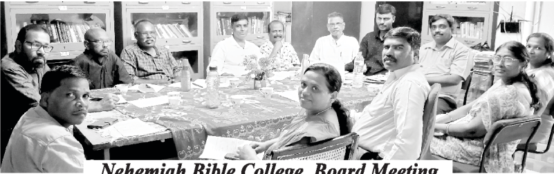
Nehemiah Bible College Board Meeting

દુનિયાભરના સર્વ દેશોની શાંતિ અને સમૃદ્ધિ માટે અમે સતત પ્રાર્થના કરીએ છીએ. ખાસ કરીને, ભારતની આત્મિક સમૃદ્ધિને માટે અમે પ્રાર્થના કરીએ છીએ. અમે ઈશ્વરના