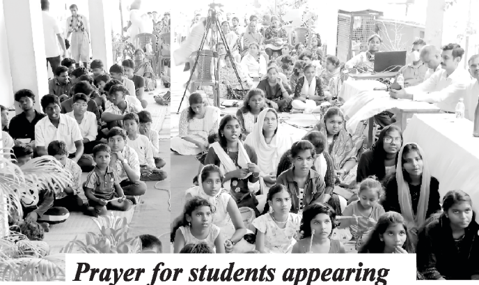
Prayer for students appearing Public Examination

સ્કૂલ માટે અને નહેમ્યા બાઈબલ કોલેજોમાંના હિન્દી અને અંગ્રેજી ભાષાઓ માટે વધુ વિદ્યાર્થીઓ, સારા શિક્ષકો અને આગેવાનોની જરૂરીયાત છે. વધુમાં, અમને અમારા ૧૬ ભાષાઓમાં પ્રકાશિત થતા ઈકો ઓફ હીજ કોલ માસિક સમાચારપત્રો માટે વધુ વાચકોની જરૂરીયાત છે. કૃપા કરીને અમને તમારા મિત્રો અને સંબંધીઓનાં વધુ સરનામા મોકલવશો, જેથી અમે તેમને મફતમાં ઈકો ઓફ હીજ કોલ તેમની ભાષાઓમાં મોકલી શકીએ. અમને ઈકો ઓફ હીજ કોલના ઉર્દુ ભાષામાં પણ વધુ વાચકોની જરૂર છે. તમારી કોઈપણ પ્રકારની સહાયતાની, નાની કે મોટી, બહુ કદર કરવામાં આવશે અને ઈશ્વર તરફથી તમને તેનો બદલો મળશે.