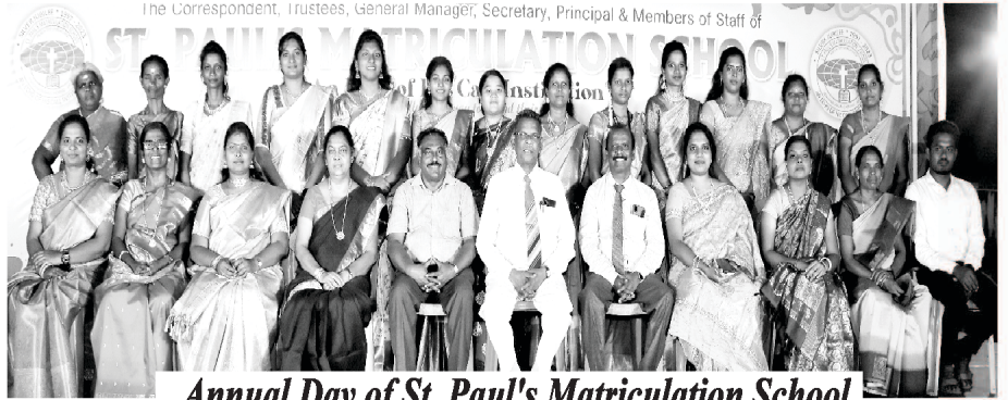
Annual Day of St. Paul's Matriculation School

प्रदर्शन गरेका थिए र यसमा धेरै अभिभावकहरू, बालबालिकाहरू र वरिपरि क्षेत्रका वासिन्दाहरू पनि सहभागी हुनुभएको थियो। यो सम्मेलन र छुटकाराको बैठकजस्तो देखिएको थियो र तपाईंको निरन्तरको प्रार्थनाको निमित्त हामी कृतज्ञ छौं।