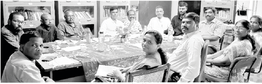
Nehemiah Bible College Board Meeting

तपाईंका मित्रहरू र आफन्तहरूका धेरै ठेगानाहरू हामीलाई कृपया उपलब्ध गराइदिनुहोस् ताकि हामीले निःशुल्क उहाँको भाषाहरूमा बोलावटको प्रतिध्वनि पठाउन सकौं। हामीलाई ऊर्दू भाषामा भएको बोलावटको प्रतिध्वनिको निम्ति अझ धेरै पाठकहरूको आवश्यकता छ। सानो वा ठूलो, कुनै पनि तरिकामा तपाईंको सहायता खुसीसाथ स्वीकार गरिनेछ र परमेश्वरले तपाईंलाई इनाम दिनुहुनेछ।