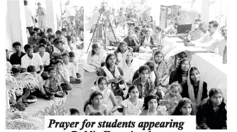
Prayer for students appearing Public Examination

तपाईंका मित्रहरू र आफन्तहरूका धेरै ठेगानाहरू हामीलाई कृपया उपलब्ध गराइदिनुहोस् ताकि हामीले निःशुल्क उहाँको भाषाहरूमा बोलावटको प्रतिध्वनि पठाउन सकौं। हामीलाई ऊर्दू भाषामा भएको बोलावटको प्रतिध्वनिको निम्ति अझ धेरै पाठकहरूको आवश्यकता छ। सानो वा ठूलो, कुनै पनि तरिकामा तपाईंको सहायता खुसीसाथ स्वीकार गरिनेछ र परमेश्वरले तपाईंलाई इनाम दिनुहुनेछ।