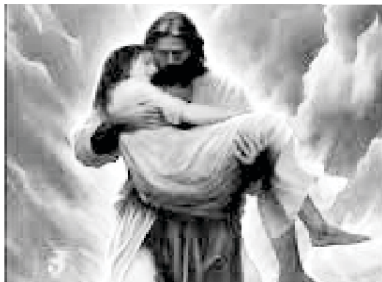
ଯୀଶୁ ଆପଣଙ୍କ ପ୍ରତି ଯତ୍ନଶୀଳ

ଈଶ୍ୱର ଆମକୁ ଶରଣତୀନର ଭାରୀ ଓ କ୍ଳାନ୍ତିକର ଯୁଆଳି ଅଧୀନରୁ ବାହାରି ତ୍ରାଣକର୍ତ୍ତାଙ୍କର ଯୁଆଳି