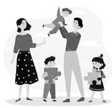
ଇଶ୍ୱର ସେମାନଙ୍କୁ ତିନୋଟି ସନ୍ତାନ ଦେଇ ଆଶୀର୍ବାଦ କରିଥିଲେ ।

ଇଶ୍ୱରଙ୍କର ପ୍ରଶଂସା ହେଉ । ପ୍ରାୟ ଦୁଇ ମାସ ପରେ, ମୁଁ ଅଷ୍ଟ୍ରେଲିଆରୁ ଭାରତକୁ ଫେରୁଥିଲି । ଯେତେବେଳେ ମୁଁ ବିମାନ ବନ୍ଦରରେ ପହଞ୍ଚିଲି, ସେଠାରେ ସେହି ଦମ୍ପତିଙ୍କୁ ମୋ’ ନିମନ୍ତେ ଗୋଟିଏ ବଡ଼ ଉପହାର ପ୍ୟାକେଟ ଆଣିଥିବାର ଦେଖିଲି । ମୁଁ ଏହା ଦେଖି ଆଶ୍ଚର୍ଯ୍ୟ ହେଲି ଯେ ସେମାନେ ସେହି ବିମାନ ବନ୍ଦରରେ ପ୍ରାୟ ୧୦ ମିନିଟ ଧରି କ୍ରନ୍ଦନ କରୁଥିଲେ । ସମଗ୍ର ଜନତା ସେମାନଙ୍କୁ ଦେଖୁଥିଲା ।