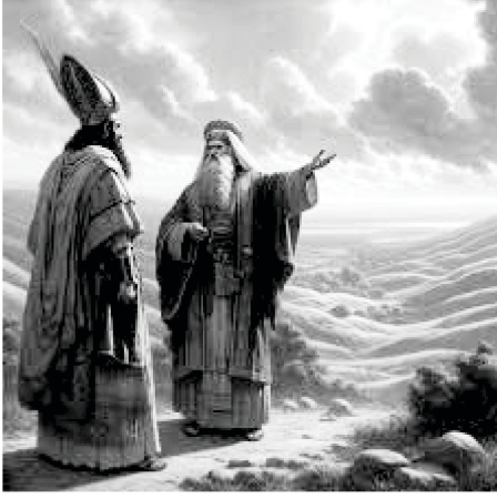
ମୋୟାବର ରାଜା ଇସ୍ରାଏଲୀୟମାନଙ୍କୁ ଅଭିଶାପ ଦେବା ପାଇଁ ବିଲିୟମଙ୍କୁ ଅନୁରୋଧ କରିଥିଲେ ।

ଗଣନା ପୁସ୍ତକର ୨୨ ଅଧ୍ୟାୟରେ ଭାବବାଦୀ ବିଲିୟମଙ୍କର କାହାଣୀ ଅଛି । ବାଲକରେ ଲେଖାଅଛି ଯେ ତାଙ୍କ ନିକଟରେ ଆଶୀର୍ବାଦ କରିବାର ଓ ଅଭିଶାପ ଦେବାର ଶକ୍ତି ଥିଲା, ସେଥିପାଇଁ ମୋୟାବର ରାଜା, ବାଲାକ ଇସ୍ରାଏଲୀୟମାନଙ୍କୁ ଅଭିଶାପ ଦେବା ପାଇଁ ତାଙ୍କୁ ଡିନିଅର ଅନୁରୋଧ କରିଥିଲେ । ଏହା ଯେ ଇଶ୍ଵରଙ୍କ ଇଚ୍ଛା ନୁହେଁ, ତାହା ସେ ପ୍ରଥମରୁ ଜାଣିଥିଲେ । କିନ୍ତୁ ସେ ସେହି ଦ୍ଵାର ନିକଟରେ ବନ୍ଧା ଯାଇଥିବା ଗଧ ସଦୃଶ ଥିଲେ - ଅର୍ଥ, ଯଶ, ସଂପତ୍ତି, କର୍ତ୍ତୃତ୍ଵ ଓ ସମ୍ମାନ ସହିତ ବନ୍ଧା ଯାଇଥିଲେ । ଇଶ୍ଵର ଯାହା ଚାହୁଁଥିଲେ ଓ ସେ ଯାହା ଚାହୁଁଥିଲେ -