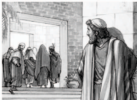
ପିତର କିଛି ଦୂରରେ ରହି ତାଙ୍କର ଅନୁଗମନ କରୁଥିଲେ ।

ବାଇବଲ ଏପରି ଜଣେ ବ୍ୟକ୍ତିଙ୍କ ବିଷୟରେ ବର୍ଣ୍ଣନା କରିଛି ଯିଏ କିଛି ଦୂରତାରେ ରହି ଯୀଶୁ