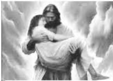
ਯਿਸੂ ਤੁਹਾਡਾ ਧਿਆਨ ਰੱਖਦਾ ਹੈ।

ਪਰਮੇਸ਼ੁਰ ਸਾਨੂੰ ਸ਼ੈਤਾਨ ਦੇ ਜੁਲੇ ਹੇਠ ਰੁੱਝੇ ਰਹਿਣ ਤੋਂ ਬਾਹਰ ਆਉਣ ਵਿੱਚ ਸਹਾਇਤਾ ਕਰੇ,