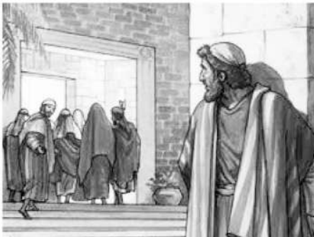
ਪਤਰਸ ਨੇ ਇੱਕ ਦੂਰੀ ਤੋਂ ਉਸ ਦਾ ਪਿੱਛਾ ਕੀਤਾ

ਬਾਈਬਲ ਵਿੱਚ ਇੱਕ ਆਦਮੀ ਦਾ ਬਿਰਤਾਂਤ ਦੱਸਿਆ ਗਿਆ ਹੈ ਜਿਸ ਨੇ ਯਿਸੂ ਮਸੀਹ ਨੂੰ ਦੂਰੋਂ ਪਿਛਾ ਕੀਤਾ ਸੀ ਅਤੇ ਬਾਅਦ ਵਿੱਚ ਵਾਪਰੀਆਂ ਘਟਨਾਵਾਂ ਦੀ ਵਿਆਖਿਆ ਕੀਤੀ ਸੀ।