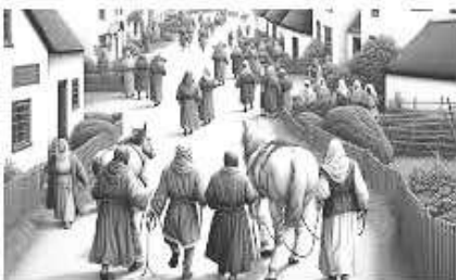
ਚੋਲਿਆਂ ਨੇ ਗਧੀ ਨੂੰ ਬੰਨ੍ਹਿਆ ਹੋਏ ਪਾਇਆ।

"ਉਸ ਨੇ ਉਨ੍ਹਾਂ ਨੂੰ ਕਿਹਾ, ਆਪਣੇ ਜਾਹਮਣੇ ਵਾਲੇ ਪਿੰਡ ਵਿੱਚ ਜਾਓ। ਅਤੇ ਜਿਵੇਂ ਹੀ ਤੁਸੀਂ ਇਸ ਵਿੱਚ ਦਾਖਲ ਹੋਵੋਗੇ, ਤੁਹਾਨੂੰ ਇੱਕ ਗਧੀ ਦਾ ਬੱਚਾ ਬੰਨ੍ਹਿਆ ਹੋਇਆ ਮਿਲੇਗਾ, ਜਿਸ ਉੱਤੇ ਕੋਈ ਨਹੀਂ ਬੈਠਾ ਹੈ। ਇਸ ਨੂੰ ਖੋਲ੍ਹੋ ਅਤੇ ਲਿਆਓ।" (ਮਰਕੁਸ 11:2)।