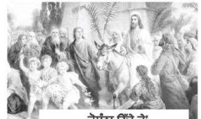
ਹੇਸ਼ਨਾ ਉੱਚੇ ਤੇ

ਉਹ ਉਸ ਬੱਚੇ ਨੂੰ ਯਿਸੂ ਕੋਲ ਲਿਆਏ ਅਤੇ ਆਪਣੇ ਕੱਪੜੇ ਉਸ ਉੱਤੇ ਪਾ ਦਿੱਤੇ ਅਤੇ ਉਹ ਉਸ ਉੱਤੇ ਸੁਆਹ ਹੋਇਆ ਤਾਂ ਬਹੁਤਿਆਂ ਨੇ ਆਪਣੇ ਕੱਪੜੇ ਰਾਹ ਵਿੱਚ ਵਿਛਾਏ ਅਤੇ ਰੋਰਨਾਂ ਨੇ ਖੇਤਾਂ ਵਿੱਚੋਂ ਹਰੀਆਂ ਟਰਈਆਂ ਵੱਢ ਕੇ ਵਿਛਾ ਦਿੱਤੀਆਂ। (ਮਰਕੁਸ 11:7-8)