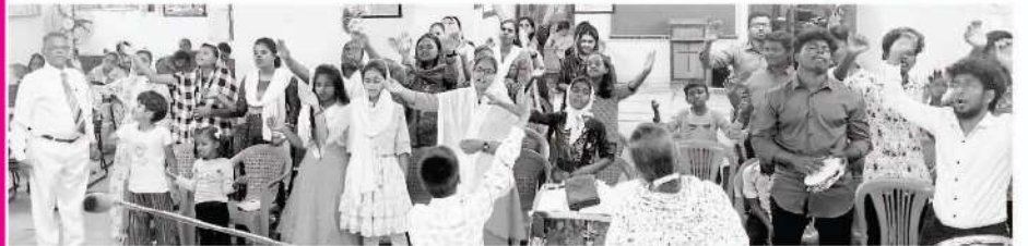
Children and Youth Rally

প্রতি রবিবার মণ্ডলী উপাসনার পর আমরা নিয়মিত অল্প বয়েসী শিশুদের সঙ্গে মিলিত হই। এই