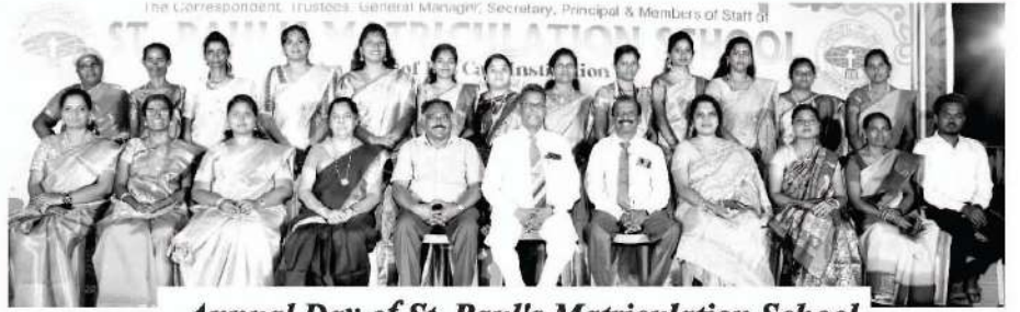
Annual Day of St. Paul's Matriculation School

আমরা ১৬টি ভাষায় প্রকাশিত তাঁর আহ্বানের প্রতিধ্বনি মাসিক পত্রিকা প্রকাশনা, ৪টি ভাষায় সম্প্রচারিত তাঁর আহ্বানের প্রতিধ্বনি ইউটিউব চ্যানেল, তিনটি ভাষায় ডাকযোগে প্রাথমিক বাইবেল পাঠক্রম-বাইবেলেকোর, ২টি ভাষায় ডাকযোগে দ্বিতীয়তাত্ত্বিক পাঠক্রম, তিনটি বিভিন্ন স্থানে নহিমিয় বাইবেল কলেজ, সেন্টপলস ম্যাট্রিকুলেশন স্কুল (গ্রামীন ইংরাজী মাধ্যম স্কুল), প্রধান মণ্ডলী, এবং শাখামণ্ডলীগুলি সহ আমাদের বহুমুখী পরিচর্যাগুলির থেকে সাড়া লাভ করে রোমাঞ্চিত হয়েছি। আমরা পৃথিবীতে সুসমাচার প্রসারিত করার কাজে সক্রিয়ভাবে নিযুক্ত আছি। আমরা আন্তরিকভাবে আপনাদের সমর্থন এবং দয়ার প্রশংসা করি, এবং আমরা আগ্রহের সঙ্গে আপনাদের সাড়াদানের বিষয় অপেক্ষা করছি।