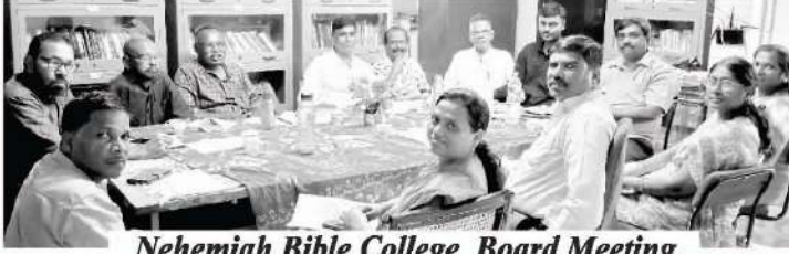
Nehemiah Bible College Board Meeting

শিশুরা ঈশ্বরের পথে বড় হচ্ছে। আমাদের সেন্টপলস ম্যাট্রিকুলেশনস্কুল এবং হিন্দি ও তামিল ভাষায় পরিচালিত নহিমিয় বাইবেল কলেজগুলির জন্য আমাদের আরও অধিক শিক্ষার্থী, উত্তম শিক্ষক শিক্ষিকা, এবং পরিচালনাকারীদের প্রয়োজন। অধিকন্তু, আমাদের ১৬টি ভাষায় প্রকাশিত তাঁর আহ্বানের প্রতিধ্বনি পত্রিকাটির জন্য আরও অধিক পাঠক পাঠিকার প্রয়োজন। অনুগ্রহ করে আপনাদের বন্ধুবান্ধব এবং আত্মীয়দের ঠিকানা আমাদের পাঠান, যাতে আমরা তাদের ভাষায় তাদের কাছে বিনামূল্যে আহ্বানের প্রতিধ্বনি পত্রিকাটি পাঠাতে পারি। উর্দু ভাষায় প্রকাশিত তাঁর আহ্বানের প্রতিধ্বনি পত্রিকাটির জন্যেও আমাদের আরও পাঠকদের প্রয়োজন। ছোট অথবা বড়, যে কোনও ভাবে আপনার সহযোগিতা, মহানভাবে