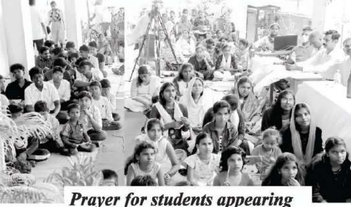
Prayer for students appearing Public Examination

শিশুরা ঈশ্বরের পথে বড় হচ্ছে। আমাদের সেন্টপলস ম্যাট্রিকুলেশনস্কুল এবং হিন্দি ও তামিল ভাষায় পরিচালিত নহিমিয় বাইবেল কলেজগুলির জন্য আমাদের আরও অধিক শিক্ষার্থী, উত্তম শিক্ষক শিক্ষিকা, এবং পরিচালনাকারীদের প্রয়োজন। অধিকন্তু, আমাদের ১৬টি ভাষায় প্রকাশিত তাঁর আহ্বানের প্রতিধ্বনি পত্রিকাটির জন্য আরও অধিক পাঠক পাঠিকার প্রয়োজন। অনুগ্রহ করে আপনাদের বন্ধুবান্ধব এবং আত্মীয়দের ঠিকানা আমাদের পাঠান, যাতে আমরা তাদের ভাষায় তাদের কাছে বিনামূল্যে আহ্বানের প্রতিধ্বনি পত্রিকাটি পাঠাতে পারি। উর্দু ভাষায় প্রকাশিত তাঁর আহ্বানের প্রতিধ্বনি পত্রিকাটির জন্যেও আমাদের আরও পাঠকদের প্রয়োজন। ছোট অথবা বড়, যে কোনও ভাবে আপনার সহযোগিতা, মহানভাবে