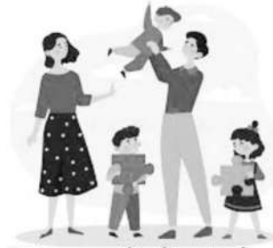
ঈশ্বর তাদের তিনটি সন্তান দিয়ে আশীর্বাদ করেছিলেন

প্রভু এবং ত্রাণকর্তা যীশু খ্রীষ্ট, আমি যাঁর প্রচার করি তিনি সন্তানহীনদের সন্তান দিতে পারেন, অসুস্থদের সুস্থ করতে পারেন এবং অন্য বিভিন্নভাবে আশীর্বাদ করতে পারেন। তিনি গতকাল, আজ এবং চিরকাল একই আছেন। ঈশ্বরের গৌরব হোক!