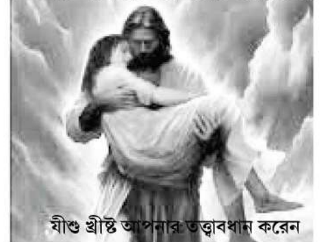
যীশু খ্রীষ্ট আপনার তত্ত্বাবধান করেন