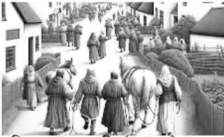
শিষ্যরা দেখলেন একটি গর্দভ-শাবক বাঁধা আছে।

তিনি বলেছিলেন, “তোমরা সামনের ঐ গ্রামটিতে যাও। সেখানে প্রবেশ করা মাত্র তোমরা দেখবে একটি গর্দভ-শাবক বাঁধা আছে, যার উপরে কেউ কখনও বসেনি। সেটিকে খুলে এখানে নিয়ে এসো” (মার্ক ১১:২)।