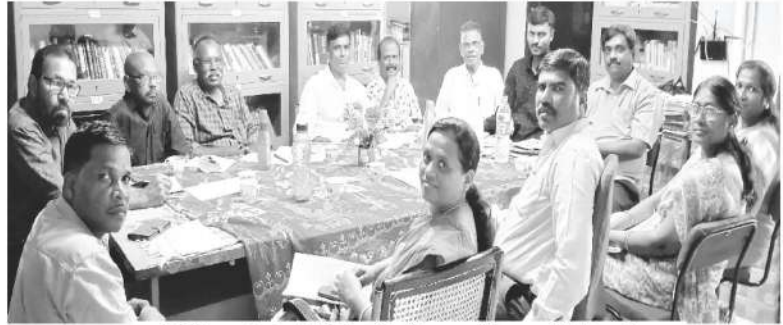
Nehemiah Bible College Board Meeting

ہم دنیا کے تمام ممالک میں امن اور خوشحالی کے لئے مسلسل دعا کرتے ہیں۔ خاص طور پر، ہم ہندوستان کی روحانی خوشحالی کے لئے دعا کرتے ہیں۔ ہم آپ پر، آپ کے خاندان اور آپ کے ملک پر خدا کی رحمتیں نازل کرنے کے لئے دعا گو ہیں۔