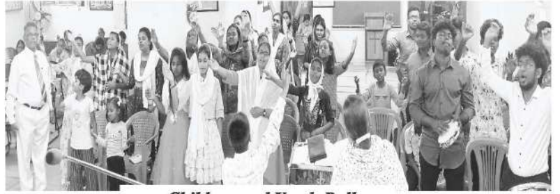
Children and Youth Rally

مزید برآں، ہمیں تمام ۱۴ زبانوں میں ماہانہ اخبار اس کی بلاہٹ کی گونج کے لئے مزید قارئین کی ضرورت ہے۔ براہ کرم ہمیں اپنے دوستوں اور رشتہ داروں کے مزید فراہم کریں، تاکہ ہم ان کی اپنی زبانوں میں اس کی بلاہٹ کی گونج مفت بھیج سکیں۔ ہمیں اردو زبان میں اس کی بلاہٹ کی گونج کے لئے مزید قارئین کی بھی ضرورت ہے۔ آپ کی کسی بھی طرح کی چھوٹی ہو یا بڑی مدد کی بہت شکرگزاری کی جائے گی، اور آپ کو خدا کی طرف سے اجر ملے گا۔