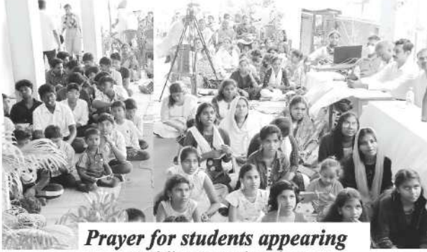
Prayer for students appearing Public Examination

پر نپیل قابل احترام ہے جان راجا رتھنم کی قیادت میں ترقی اور معمول کی سرگرمیوں پر تبادلہ خیال کرنے کے لئے ہر ماہ ملاقات کرتے ہیں۔