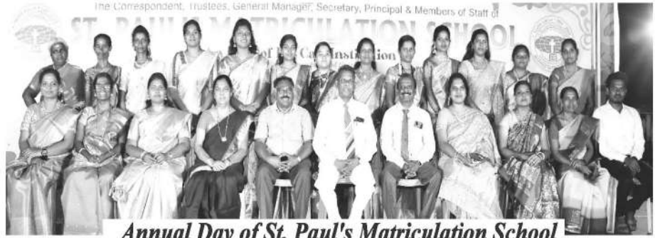
Annual Day of St. Paul's Matriculation School

سینٹ پال میٹرک اسکول میں سالانہ دن کی جشن کی کامیابی کی اطلاع دیتے ہوئے ہمیں خوشی ہو رہی ہے، جو کہ ۲ مارچ کو منعقد ہوئی۔ تقریب کے دوران طلباء نے اپنی صلاحیتوں کا مظاہرہ کیا، اور اس میں بہت سے والدین، بچوں اور ارد گرد کے علاقوں کے رہائشیوں نے شرکت کی۔ یہ جشن مجلس اور نجات کے اجلاس سے مشابہت رکھتا تھا، اور ہم آپ کی مسلسل دعاؤں کے شکر گزار ہیں۔