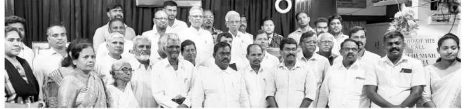
முன்னாள் மாணவர்கள் ஐக்கியக் கூட்டம்

நமது நெகேமியா வேதாகமக் கல்லூரிகளில் படித்துவிட்டு ஊழியம் செய்கிறவர்களின் முன்னாள் மாணவர்கள் ஐக்கியக் கூட்டம், 2023-2024ஆம் கல்வி ஆண்டின் மாணவர்களோடு கடந்த 13.05.2024 அன்றும், பட்டமளிப்பு விழா 01.06.2024 சனிக்கிழமை மாலை 5.00 மணிக்கும் நடைபெற்றது. 38 மாணவர்கள் பட்டம் பெற்று ஊழிய ஸ்தலங்களுக்குச் சென்றுள்ளனர்.