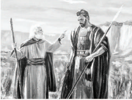
தேவனது கட்டளைக்கு கீழ்ப்படியாத சவுலை கண்டிக்கும் சாமுவேல்

(1 சாமுவேல் 15:3). ஆனால், சவுலோ ஆடு மாடுகளில் முதல்தரம் மற்றும் இரண்டாம் தரமானவைகளையும், நலமான எல்லாவற்றையும் தன்னிடமாய் வைத்துக்கொண்டதினால், தன்னைத்தானே அவன் வஞ்சித்துக் கொண்டான் (1 சாமுவேல் 15:9). எவற்றையெல்லாம் அழிக்காமல் பத்திரமாய் வைத்துக் கொள்ள வேண்டும் என்று தானே தீர்மானித்துக் கொண்டு, தான் செய்ததுதான் சரி என்று எண்ணி, தன்னைத்தானே ஏமாற்றிக் கொண்டான். மேலும், “கர்த்தருடைய வார்த்தையை நிறைவேற்றினேன்,” என்று சாமுவேலிடம் பெருமையாகக் கூறினான் (1 சாமுவேல் 15:13). ஆனால் தேவனது கட்டளைக்கு அவன் கீழ்ப்படியவில்லை.