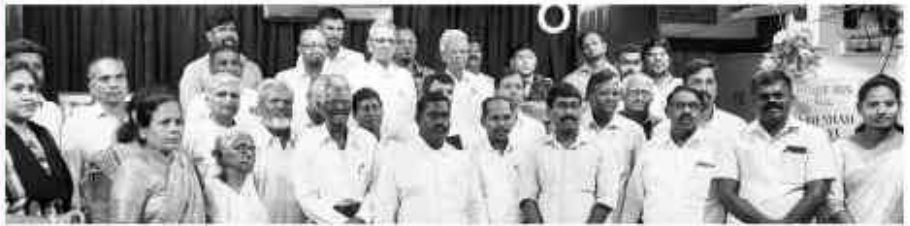
നെഹെമ്യ ബൈബിൾ കോളേജിലെ പൂർവ്വ വിദ്യാർത്ഥികൾ