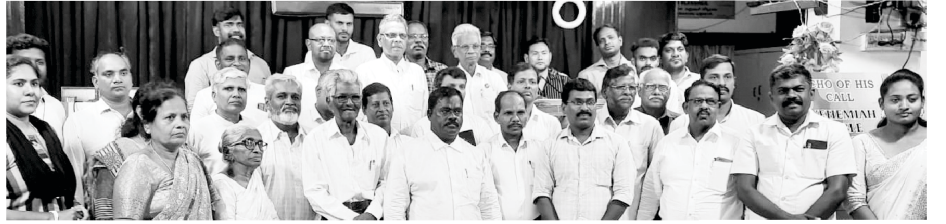
Alumini member of Nehemiah Bible College