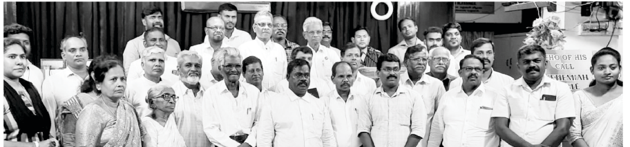
Alumini member of Nehemiah Bible College

మా నెహెమ్యా బైబిల్ కళాశాలల నుండి గ్రాడ్యుయేషన్ పొందిన విద్యార్థులు ప్రస్తుతము పరిచర్యలో ఉన్నారు మరియు పాఠ విద్యార్థులు సహవాసములో ఉన్నారు మరియు నెహెమ్యా బైబిల్ కళాశాలల యొక్క పాఠ విద్యార్థుల మీటింగ్ 13-05-2024వ సంవత్సరమున నిర్వహించబడినది. 2023-2024 అకాడమిక్ సంవత్సరమునకుగాను గ్రాడ్యుయేషన్ కార్యక్రమము 01-06-2024వ తేదిన సాయంకాలము 5 గంటలకు నిర్వహించబడినది. 38 మంది విద్యార్థులు ఈ సంవత్సరము గ్రాడ్యుయేషన్ పొందారు మరియు వారి పరిచర్య కొరకై అనేక మిషన్ కేంద్రాలకు వెళ్లారు.