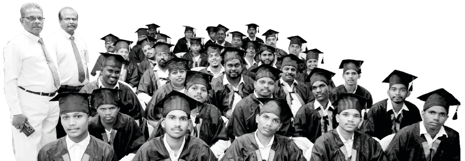
The Graduation Service for the academic year 2023-2024