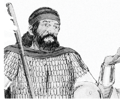
Saul tries to justify disobedience in a spiritual way

గర్వము మరియు తనను తాను మోసపరచుకొనుట అనునవి అతని కన్నులకు గ్రుడ్డితనము కలుగజేశాయి, అతని హృదయమును మందగింపజేశాయి, అతని చెవులను వినకుండునట్లు చేశాయి ఈ విధముగా దేవుని స్వర్ణమును వినకుండా ఆపివేశాయి. అతడు ప్రజలను నిందించుచు ఈలాగున చెప్పాడు- గొట్టెలలో మరియు ఎద్దులలో మంచినాటిని దేవునికి బలిగా అర్పించుటకు ప్రజలు వాటిని చంపలేదు నేను కాదు. సౌలు తన