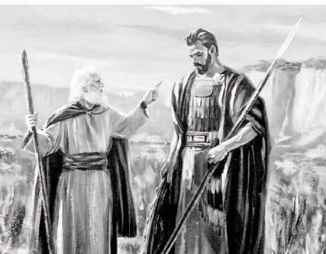
Samuel reprimands Saul for disobeying God's Command

ఉదాహరణకు, దేవుడు అమాలేకీయులను సర్వ నాశనము చేయుమని ఆజ్ఞాపించాడు, నీవు పోయి బొత్తిగా పాడుచేయుము. (1 సమూయేలు 15:2). ఏది ఏమైనా, మంచినాటిని నిర్మూలము చేయక ఉంచుకొనుటకు నిర్ణయము తీసుకొనుటచేత సౌలు తనను తాను మోసపుచ్చుకున్నాడు (1 సమూయేలు 15:9). మంచినాటిని నిర్మూలము చేయకుండా ఉంచుకొను వాటి విషయములో తనకు తానే నిర్ణయము తీసుకున్నాడు అందుచేత తన పనులను తానే సమర్థించుకోవడము చేత తనను తానే మోసపరచుకొన్నాడు. సౌలు నేను ప్రభువు అజ్ఞను గైకొన్నాను అని కూడా చెప్పాడు (1 సమూయేలు 15:13). దేవుడు ఇచ్చిన ఆజ్ఞలనుండి తప్పిపోయినప్పటికి తాను ఆ విధముగా భావించాడు.