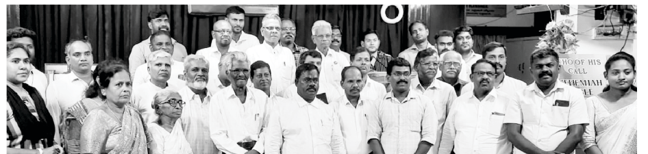
Alumini member of Nehemiah Bible College

ශාන්ත පාවුළු මෙට්‍රිකියුලේෂන් කිතුණු පාසලේ ඉංග්‍රීසි භාෂාවෙන් ඉගෙන ගැනීමට අවශ්‍ය ශිෂ්‍යයින් ලබා දෙන්නය කියාද යාවැසා කරන්න. තවද ශුභාරංචිය නොගියාවූ