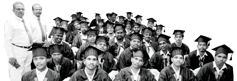
The Graduation Service for the academic year 2023-2024

Our Ministries: ECHO OF HIS CALL Monthly Magazines (16 languages) BIBLECOR - Postal Courses (3 languages) YouTube Ministry Online Courses Theological Correspondence Courses (2 languages) Church Planting Nehemiah Bible Colleges Gospel Printing Press Great Commission Partners St. Paul's Matriculation School Crusades Community Development