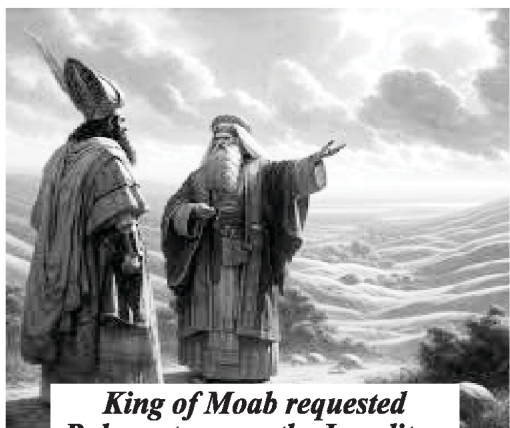
King of Moab requested Balaam to curse the Israelites.

ගණන් කථාව 22 වන පරිච්ඡේදයෙහි අනාගතවක්තෘ බාලාම් ගැන සඳහන් කරයි. ඔහුට ආශීර්වාද කිරීමටද බලය තිබුණි. ඉශ්‍රායෙල් සෙනඟට ශාප කරන පිණිස මෝවබිහි රජතුමා බාලාම්ගෙන් තුන්වතාවක්ම ඉල්ලීමක් කරනු ලැබුවා. පටන්ගැනීමේ සිට එය දෙවියන්වහන්සේගේ කැමැත්ත නොවෙයි කියා බාලාම් දැනගෙන සිටියේය. නමුත් ඔහු මෙම කොටඵවා මෙන් පාරවල් දෙකක් අතර සිටියේය. මුදල්, ජනප්‍රියකම, තනතුරු, බලය, හා අන් අයගේ අවධානය ලබා ගැනීම යන මේ සියල්ලෙන්ම හිරවී දෙවියන්වහන්සේගේ කැමැත්ත කිරීමට බැරිය කියන ස්ථානයෙහි සිටියේය.