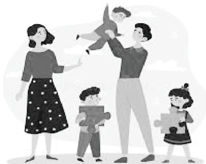
God granted three children and blessed them.

ප්‍රසිද්ධ වෛද්‍යවරුන් වෙතට ගියා නමුත් ඔවුන්ට අප උදෙසා කිසි දෙයක් කිරීමට බැර විය. එම නිසා “යාවිඤ්ඤාවෙන් දරුවෙක් ලැබෙන්නේ කොතොමද?” ඇසුවේය. මා ඔවුන් සමඟ වාසි වී ඇදහිල්ල ගැන හා දෙවියන්වහන්සේගේ බලය ගැන ඔවුන්ට පැහැදිලිකර දුන්නෙමි. පසුව මා ඔවුන් සමඟ යාවිඤ්ඤා කලෙමි.