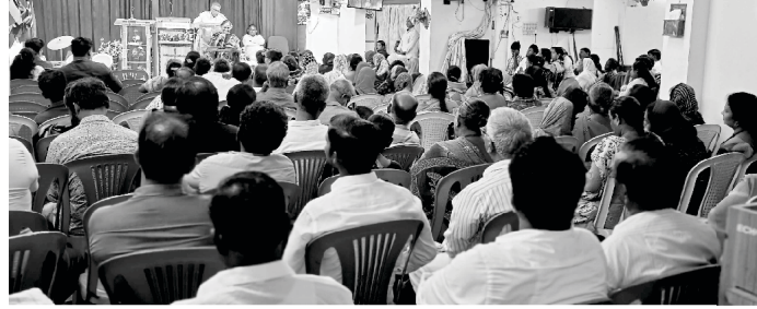
A conference held in the Main Church

ഈ സംരംഭം നമ്മുടെ മുഖ്യസഭയിലും സെന്റ് പോൾസ് മെട്രിക്കുലേഷൻ സ്കൂളിലും, പ്രത്യേകിച്ച് യുവാക്കൾക്കിടയിൽ ശ്രദ്ധേയമായ പുനരുജ്ജീവനത്തിനു കാരണമായി. ലോകമെമ്പാടുമുള്ള ഞങ്ങളുടെ സുഹൃത്തുക്കളിൽനിന്ന് ഞങ്ങൾക്ക് നിരവധി സാക്ഷ്യങ്ങൾ ലഭിച്ചുകൊണ്ടിരിക്കുന്നു. ഈ ചെറുപ്പക്കാർക്കായി ഓഗസ്റ്റ് 11-ാം തീയതി മുഖ്യസഭയിൽ ഒരു സമ്മേളനം സംഘടിപ്പിച്ചു. സകല ബഹുമാനവും മഹത്വവും നമ്മുടെ കർത്താവായ യേശുക്രിസ്തുവിനുള്ളത്.